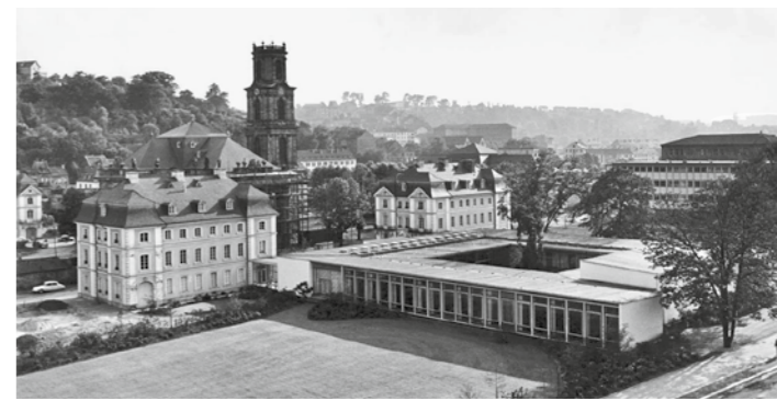
Der Atriumbau der Staatskanzlei vor mehr als 50 Jahren aus der Luft gesehen (oben) und eine aktuelle Ansicht auf den Innenhof (unten)

Von 1945 bis 1948 war die Regierungszentrale im Gebäude Scheidterstraße 114 auf dem Saarbrücker Rotenbühl und danach im „Weißen Haus“ (Villa Rexroth) in der Bismarckstraße untergebracht.