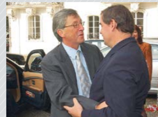
2008: Jean-Claude Juncker, Premierminister Luxemburgs, ein Freund und regelmäßiger Gast von Ministerpräsident Peter Müller.