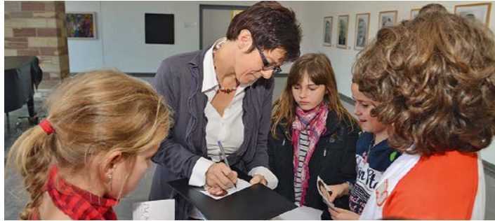
Ministerpräsidentin Annegret Kramp-Karrenbauer mit jungen Gästen beim Kindertag der Staatskanzlei

Die Schaltzentrale der Regierungspolitik steht allen Bürgerinnen und Bürgern offen. Sie ist eine Plattform des offenen Meinungsaustauschs, ein Forum der aktiven Bürgerpolitik. Jedes Jahr finden hier zahlreiche Konferenzen, Veranstaltungen und Empfänge für gesellschaftliche Gruppen und ehrenamtliche Organisationen statt.