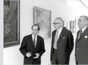
1969: Bundespräsident Gustav Heinemann zu Besuch bei Ministerpräsident Franz-Josef Röder.

Alle Bundespräsidenten von Theodor Heuss bis Joachim Gauck waren zum Teil mehrmals Gast der Staatskanzlei. Auch bekannte ausländische Politiker, Prominente aus europäischen Adelshäusern und Künstler statteten der Staatskanzlei einen Besuch ab.