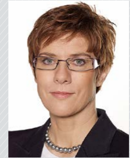
Annegret Kramp-Karrenbauer Ministerpräsidentin des Saarlandes