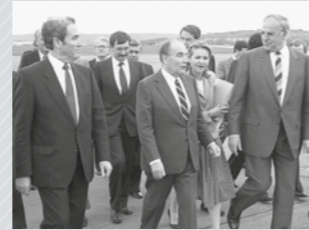
1984: Ministerpräsident Werner Zeyer und Bundeskanzler Helmut Kohl holen den französischen Präsidenten François Mitterrand am Flughafen Ensheim ab.