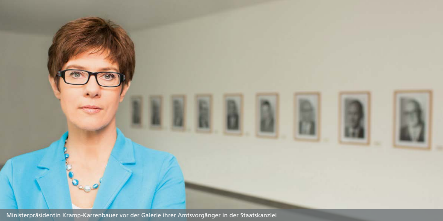
Ministerpräsidentin Kramp-Karrenbauer vor der Galerie ihrer Amtsvorgänger in der Staatskanzlei

Bis 2014 ist Annegret Kramp-Karrenbauer auch „Bevollmächtigte der Bundesrepublik Deutschland für kulturelle Angelegenheiten im Rahmen des Vertrages über die deutsch-französische Zusammenarbeit“; im Namen der 16 Länderkulturminister bringt sie mit den Regierungen in Berlin und Paris gemeinsame Projekte auf den Weg.