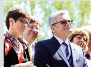
2013: Bundespräsident Joachim Gauck bei seinem Antrittsbesuch mit Ministerpräsidentin Annegret Kramp-Karrenbauer.